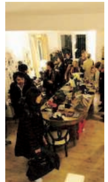
IL FASHION PARTY Una passata edizione del temporary shopping